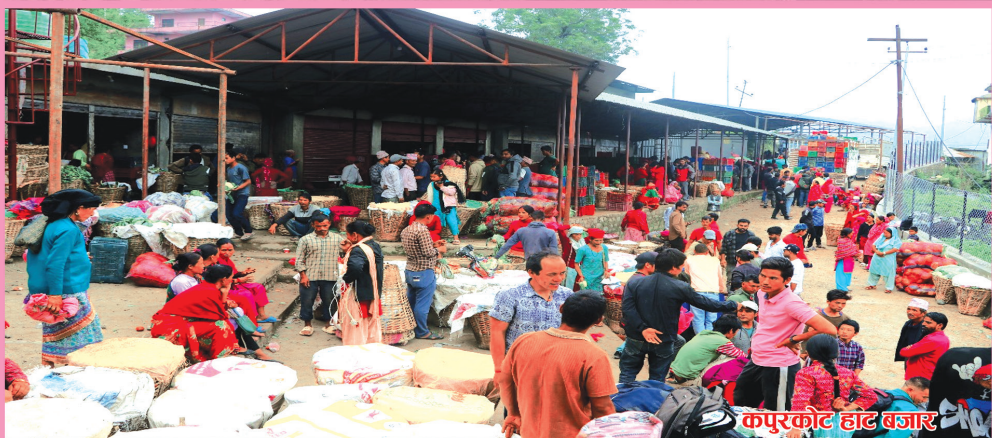
कपुरकोट हाट बजार