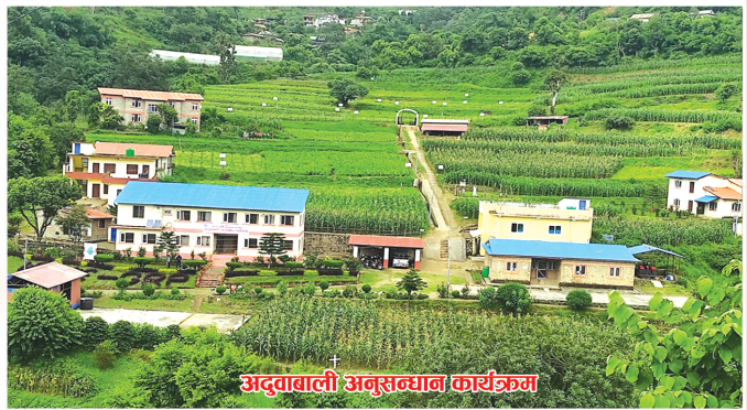
अदुवावाली अनुसन्धान कार्यक्रम