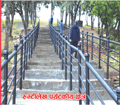
रुग्नीलेस पर्यटकीय क्षेत्र