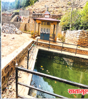
सातामूल धार्मिक क्षेत्र