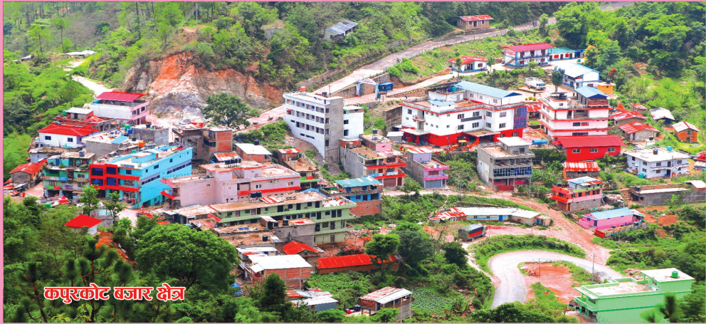
कपुरकोट बजार क्षेत्र